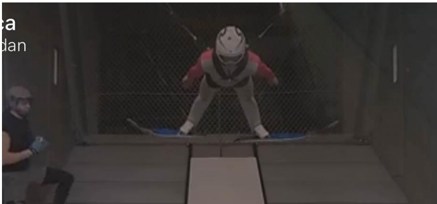
Bild från träning hos Wing suit

Bilder från läger i Ö-Viks fina anläggning.